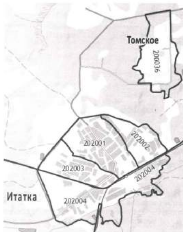
Рис. 1.1. Кадатровое деление с. Итатка и с. Томское

Водоснабжение населенных пунктов осуществляется из подземных источников. Централизованные системы водоснабжения имеются на территории с. Итатское, с. Томское. В указанных населенных пунктах ведется добыча подземных вод для питьевого, хозяйственно-бытового водоснабжения населения и технологического обеспечения сельскохозяйственных объектов, предприятий и учреждений. В остальных населенных пунктах (п. Каракозово, п. Южный и п. Черная речка) водоснабжение потребителей децентрализованное: используются индивидуальные скважины. Структура системы водоснабжения Итатского СП показана на рис. 1.2.