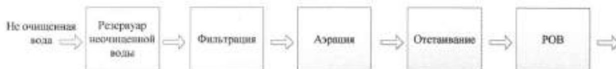
Рис. 1.4. Блок-схема станции обезжелезивания с. Томское

Блок-схема станции обезжелезивания с. Томское показана на рис. 1.4.