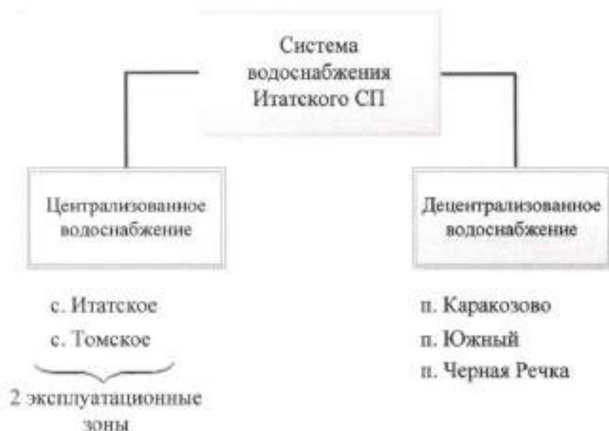
Рис. 1.2. Структура системы водоснабжения Итатского СП

Централизованная система водоотведения в Итатском сельском поселении существует только в с. Томское. Водоотведение в остальных населенных пунктах поселения осуществляется на выгреб с последующим вывозом на сельские свалки, расположенные в непосредственной близости от населенных пунктов. Эксплуатационные зоны централизованных систем водоснабжения показаны в Приложении 1.